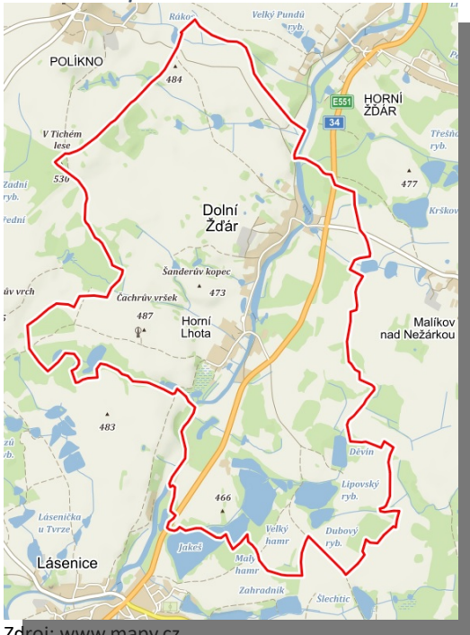
Obrázek 1 Mapa obce Dolní Žďár