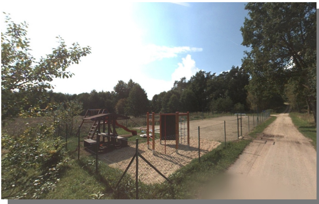
Obrázek 2 Sportoviště s dětským hřištěm – pohled od silnice

Obec Dolní Žďár je vlastníkem a také správcem objektu sportoviště. Jedná se o kombinované hřiště na míčové sporty s dětským hřištěm (houpačky, skluzavky, apod.) a cvičebními prvky pro seniory. Hřiště lze užívat na malou kopanou, nohejbal či volejbal.